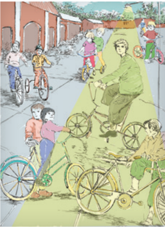
تصویر ساز: نند ظاهری