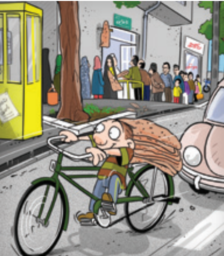
تصویر ساز: سعید طارقی

سه سال بعد «لوئیس گوهر» زنجیر را جایگزین طناب کرد تا حرکت آن تسهیل شود. در سال ۱۸۳۴ یک آهنگر اسکاتلندی به نام «مک‌میلان» به دوچرخه‌های موجود، پنجره کاب‌ابتدایی را اضافه کرد تا دیگر احتیاجی به فشارپاروی زمین نباشد. الهام گرفتن از نقاشی‌های داوینچی برای دوچرخه در سال ۱۸۶۰ یک مهندس جوان فرانسوی، قسمت‌های چوبی دوچرخه را با لوله‌های آهنی تعویض کرد و بخش خارجی چرخ‌های چوبی را با نوارهای لاستیکی ضخیم پوشانید. این دوچرخه اولین دوچرخه ترمزدار در دوران خود محسوب می‌شد. سال ۱۸۷۳ «هاری لاسون» با الهام از نقاشی‌های داوینچی، چیزی شبیه به زنجیر را برای دوچرخه طراحی کرد و برای اولین بار نخستین دوچرخه زنجیردار به بازار آمد. سال ۱۸۸۱ دوچرخه‌های زنجیردار با اتصال به مرکز چرخ عقب و با بلبرینگ به بازار آمد. این دوچرخه‌ها، چرخ عقب جلوی‌شان به یک اندازه بود و این انقلابی برای صنعت دوچرخه بود.