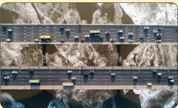
تلگراف | عبور خودروها از روی رودخانه یخ زده، چین