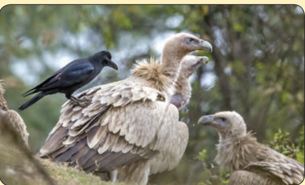
آسوشیتد پرس | همزیستی مسالمت آمیز!

• شخصیت «بو» در پویانمایی «کمپانی هیولاها» با صدای «مری کیس» در واقع فقط صدای یک کودک است. عوامل پشت صحنه قادر به نشان دادن او روی صندلی نبودند و حتی نمی توانستند دیالوگش را برایش بخوانند. او در استودیو در حال بازی کردن بود و میکروفون مخصوصی هم بدون این که بداند، به او وصل بود و صدایش را ضبط می کرد!