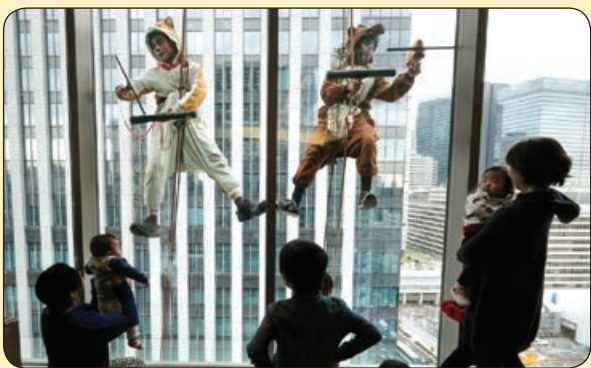
شیشه پاک کن های یک هتل با لباس عروسی سال نو، ژاپن