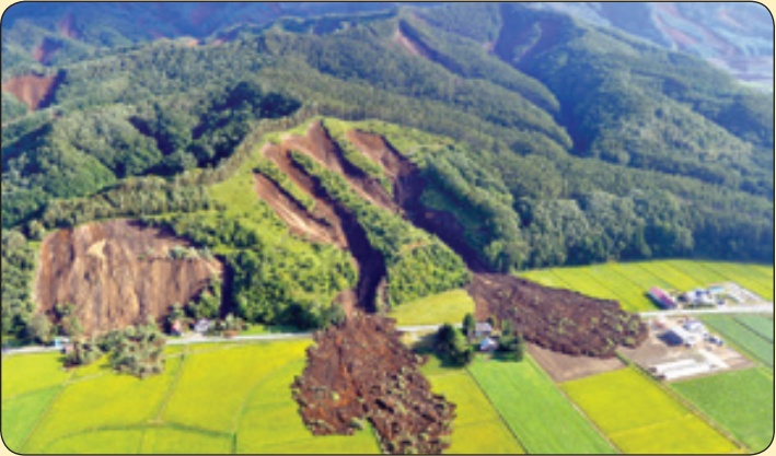
ای بی ای | رانش زمین بر اثر زلزله، زاین