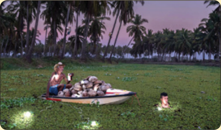
برداشت میوه نار گیل در شب، مکزیک

چو بر شکست صبا زلف عنبر افشانش به هر شکسته که پیوست تازه شد جانش کجاست همفکسی تا به شرح عرضه دهم که دل چه می کشد از روزگار هجرانش