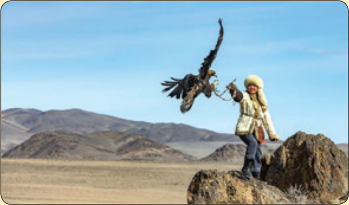
گاردین | بازگشت عقاب شکاری به سمت مری ائن

آدیتی سنترال - زن جوان هنرمند ژاپنی پر تره های بسیار واقعی از گربه های خانگی می سازد. پر تره های سه بعدی او به قدری واقعی است که با دیدن آن ها تعجب خواهید کرد که تنها با استفاده از سوزن و پشم ساخته شده و تا کسیدر می نیست. او این پر تره هارا به قیمت بالایی می فرو شد و حساسی هم مشتری دارد.