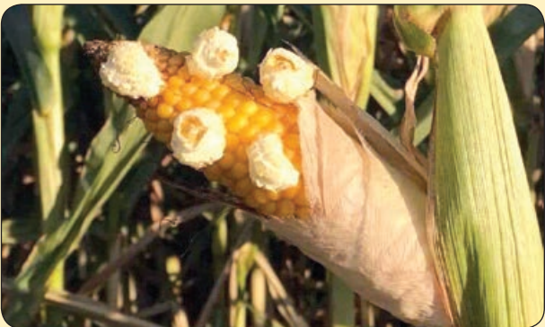
یاهو! بوته در تی که بر اثر گرما تبدیل به پف فیل شده است!

در پی خود می گشتم چه بی صدا اوج بیداری صبح بود من خزیده بودم کنج عزلت تنهایی خویش