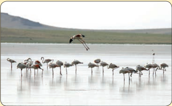
یاهو! دسته فلamingوها، ترکیه

این نوشیدنی در چین بسیار محبوب است. ورژن چینی دوغ خودمان است ولی دوغ نیست! دوغ هندی دقیقا همان دوغ ماست اگر به جای نمک، شکر داخلش بریزیم و احتمالا ایرانی ها از آن بیزار خواهند شد، ولی این نسخه چینی، دقیقا ماست و کمی شکر است که با نی می خورند. خوب است ولی در خشان نیست. اول که امتحان می کنی به خاطر مزه جدیدش و این که انتظار نوشیدنی داری ولی در حقیقت همان ماست است و باید با سختی زیاد با نی بکشی بالا، دلسرد می شوی ولی چینی ها خیلی دوستش دارند و بد هم نیست.