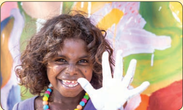
گاردین | یک کودک بومی استرالیایی در جشنواره سنتی

البته آقای پیت هم ساکت ننشسته و ظاهرا با ارائه اسنادی به دادگاه، جواب قاطعی داده است که نشان می دهد ایشان نه تنها در تامین مالی فرزندانش کوتاهی نکرده، بلکه هشت میلیون دلار هم به خانم جولی برای خرید خانه وام قرض داده است. خب این جاست که باز جادادریک ما بگویم خیلی مردی آقای پیت و باید به خانم جولی بگویم که خانم محترم، همین جوری خانه را اول کردی گذاشتی رفتی، پول یک خانه را هم گرفتت با شاک می هم هستی؟ شرمت باد خانم جولی. شما با این همه توقع، خودت برای آقای پیت چه کار کردی مگر؟ خب با اعصابی خط خطی شده و خونی کثیف شده برمی گردیم خبرها را پی می گیریم. اما در این هفته خبر رسید که «شارلیز ترون» بازیگر هالیوود، برای بازی در فیلمی، ۱۷ کیلو به وزن خودش اضافه کرده است. شما واقعا با بدن هایتان چه می کنید لعنتی ها؟ هنوز فناوری های جدید گریم کردن آیا به مملکت شما نرسیده است؟ واقعا بلد نیستید مثل ما گریم های آسان و بی دردسر کنید؟ می خواهید بگویند تو ای آن هالیوود خراب شده، یک فریم عینک در دست و حسابی پیدا نمی شد برای تغییر سن بازیگر بگذارد روی بینی اش و می روید تغییر وزن می دهید؟ البته این باعث نمی شود که ما ارزش کار خانم «شریفی نیا» را پایین بیاوریم، چون تحمل وزن همان فریم عینک هم اصلا کار آسانی نبوده است. موضوع این است که هالیوود باید خودش را کمی به روز کند. مثلا اگر قرار بود ما فیلم «پسر پچی» را که هر روز در محل مختلف زندگی یک شخصیت بود بسازیم، نهایتا با سه چهار فریم عینک در می آوردیم و این قدر خرج روی دست خودمان نمی گذاشتیم، واقعا کاش هالیوود کمی خودش را به روز کند!