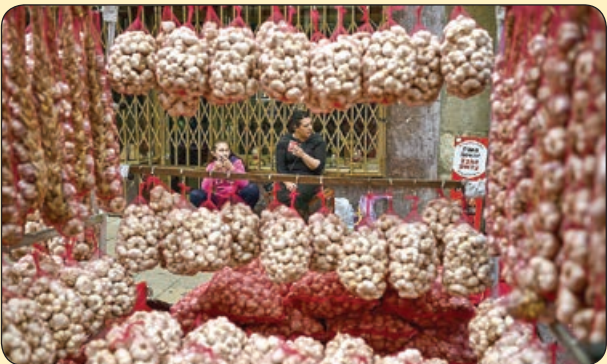
جشنواره سیر، اسپانیا