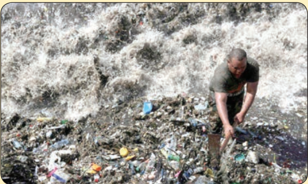
سربازی در حال پاک سازی ساحل از زباله های مردم، جمهوری دومینیکن

خبر پایانی هم این که متاسفانه مدتی است استاد جمشید مشایخی در بستر بیماری به سر می برد و البته خبر می رسد حال شان رو به بهبود است. ما واقعا صمیمانه آرزو می کنیم استاد مشایخی از بین این همه سلفی ها و شایعات به سلامت بگذرد و و هم چنان سایه شان بر سر این سینما باقی باشد، منتها وسط آن سلفی ها واقعا نمی توانیم به آقای جمشید هاشم پور چیزی نگوییم. واقعا با خودت چه کار می کنی مرد؟ تو یک زمانی قهر مان بز بن های بچگی ما بودی، دوست نداریم قاطی این سلفی ها باشی. به خودت بیا مرد!