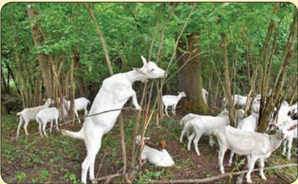
خبرگزاری تاس | بزهای بازگوش! بلاروس

واژه «شهر آورد» بسیار زیبا و متین است ولی گروهی در ست یا نادرست و شاید به این بهانه که این واژه به معنی «دربی» نیست، آن را کنار گذاشته و کلمه بیگانه «دربی» را برای مسابقات دو تیم همشهری به کار می برند؟ در حالی که واژه شهر آورد به معنای آوردگاه شهری است. ضمن این که ما نباید در این گونه موارد تنها به ترجمه توجه کنیم. ما موظف هستیم دستورات فرهنگ سازان کشور را اجرا و اشتباه های احتمالی کار را هم مانند اشتباه پزشکی قبول کنیم و از پیش خود تصمیم نگیریم.