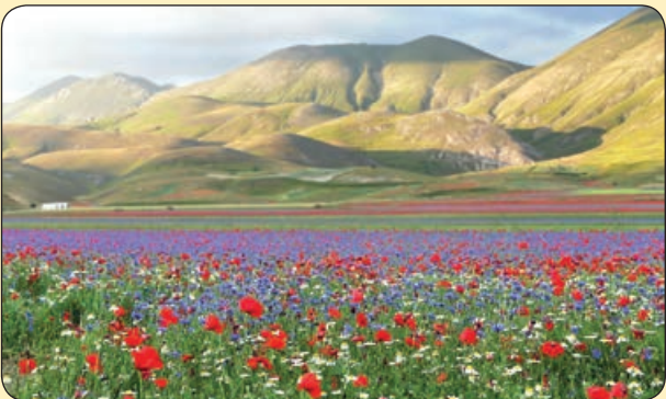
دشت شقایق، ایتالیا