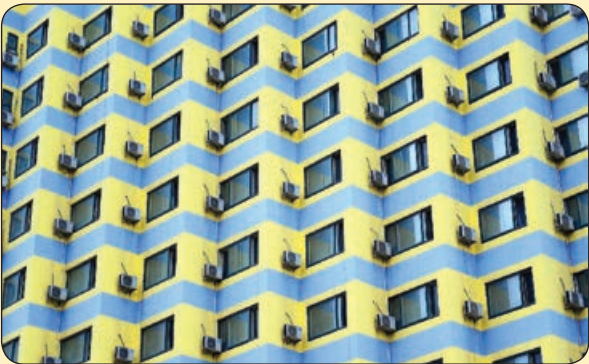
تلگراف | تحمل گرم ترین روزهای سال در چین به کمک کولر های گازی

دانشمندان کشور پرتغال به موفقیت های بزرگی در زمینه کمبود آب بهداشتی قابل شرب برای مردم جهان دست یافتند. با توجه به خشکسالی در همه نقاط جهان، این دانشمندان توانستند روش های مبتکرانه و در عین حال ساده ای را برای رفع مشکل نبود آب آشامیدنی ارائه دهند. روش هایی از قبیل نوشیدن آب پرتقال و آب هندوانه به جای آب خالی، استفاده از آب دریاچه های شیرین و مهم ترین روش، کوچک کردن بطری های آب معدنی برای سهولت در ارسال به همه جای جهان و تقسیم عادلانه بین تمام مردم دنیا که به همه دو قطره آب برسد.