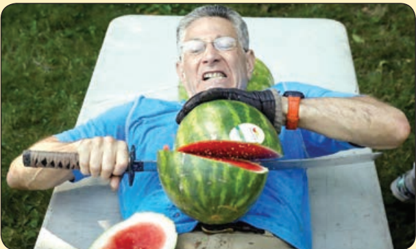
گینس رکورد | ثبت رکورد قاچ کردن تعداد بیشتری هندوانه روی شکم در یک دقیقه! ایالات متحده