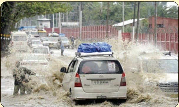
آب گرفتگی خیابان ها، هندوستان