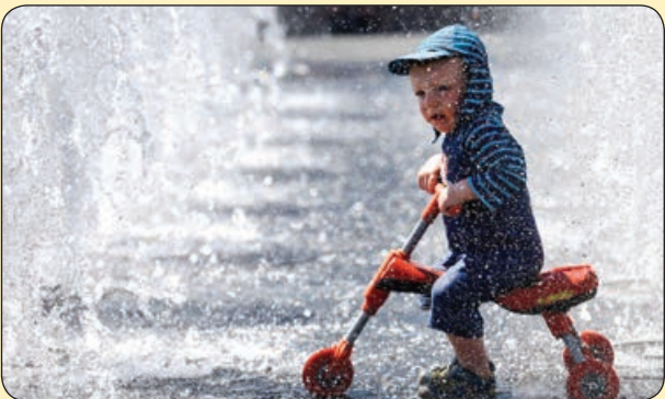
مرکوری| بازی زیر فواره های پارک در گرمای تابستان