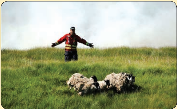
مامور آتش نشان در حال دور کردن گوسفندان از منطقه آتش سوزی. انگلستان