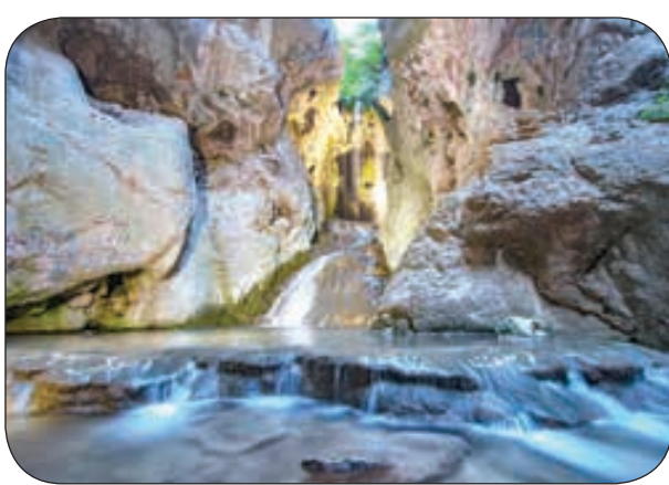
(صفحه اینستاگرام: ourlifecycles)

این آبشار زیبا در دل طبیعت جنگل های گلستان و در مرز استان های گلستان و خراسان شمالی واقع شده است و با ارتفاع تقریبی ۱۵ متر، یکی از آبشار های خزه ای ایران محسوب می شود و به فاصله کمی از جاده قرار دارد. سیل ۱۷ سال پیش و تخریب جاده قدیم جنگل ونوسازی آن باعث شد باز دید کننده های کمتری به سراغ این آبشار بروند و زباله های کمتری به جا بماند. ولی پراکنده راه رفتن باز دید کننده ها و در ستون یک نبودن آن ها باعث شده نهال های جنگلی که در آینده جانشین درختان فعلی خواهند بود فر صت رشد نداشته باشند و تخریب شوند. یعنی ما شاهد آخرین نسل درختان در حاشیه جاده ها هستیم.