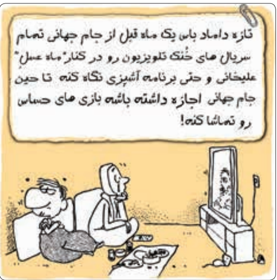
متن و اجرا: صابری، مرادی