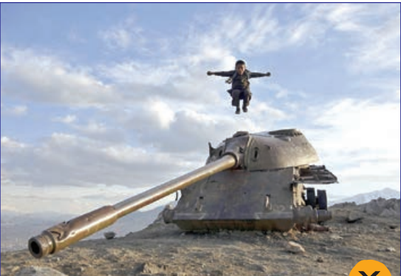
بازی کودکان با تجهیزات جنگی اسقاطی، افغانستان