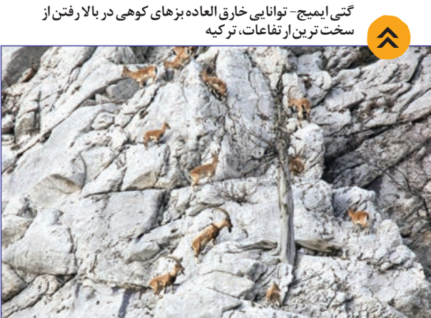
توانایی خارق العاده بزهای کوهی در بالا رفتن از سخت ترین از تفاعات، ترکیه