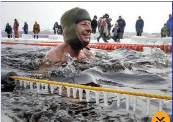
یاهو- مسابقات شنا در آب یخ، روسیه