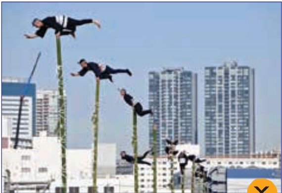
کتی ایمج- نمایش بخشی از تمرینات آتش نشانان ژاپنی