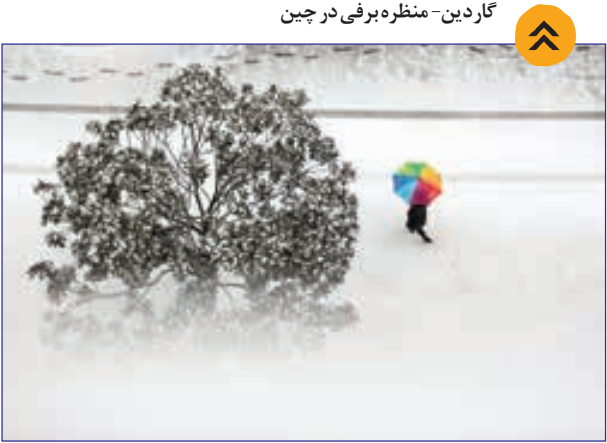
منظره برفی در چین