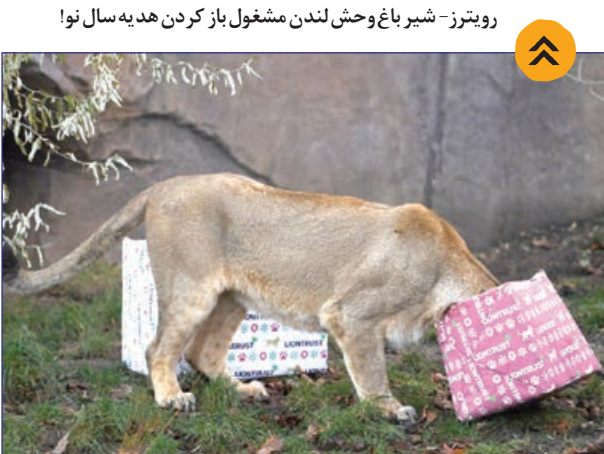
شیر باغ وحش لندن مشغول باز کردن هدیه سال نو!