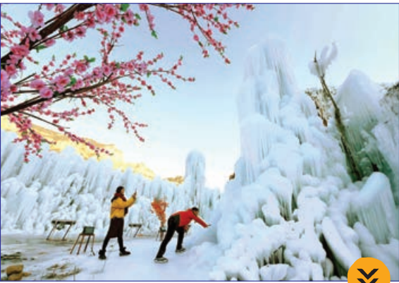
شینهو- تفریح گردشگران در مناطق یخ زده چین