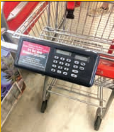
یک ماشین حساب سیار برای محاسبه قیمت‌ها