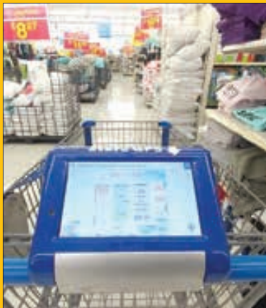
چرخ خرید با جیبی‌اسی برای نمایش نقشه فروشگاه