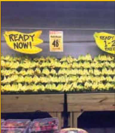
دسته‌بندی موزها بر اساس رسیده بودنشون