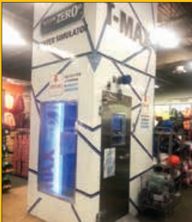
دستگاهی که سیستم شبیه‌ساز هوای زمستانی داره، برای تست کردن لباس‌های گرم