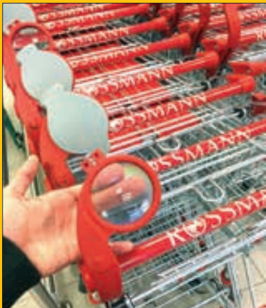
خره‌بین روی چرخ دستی برای افرادی که چشمشون ضعیفه