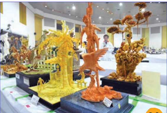
هنرنمایی با میوه و غذاها در «نمایشگاه هنر و غذای آشپزی» در سریلانکا