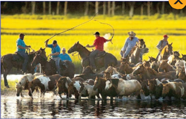
نود و دومین دوره جشنواره شنای اسب ها در ایالت ویرجینیای آمریکا