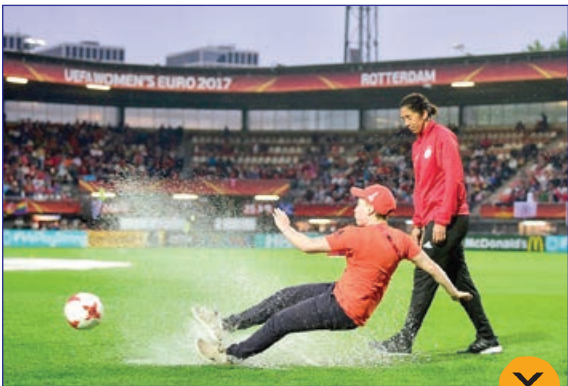
در حاشیه باز دید مربی تیم ملی زنان آلمان از زمین مسابقات قبل از آغاز مسابقات یورو زنان ۲۰۱۷، عکس از خبرگزاری فرانسه