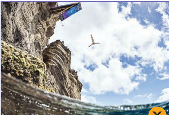
مرحله نهایی مسابقات پرش از روی صخره در پرتغال