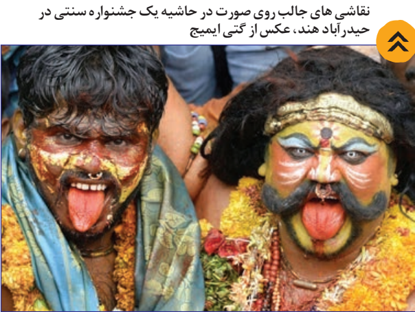
نقاشی های جالب روی صورت در حاشیه یک جشنواره سنتی در حیدرآباد هند