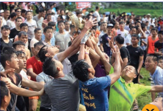
تلاش مردم برای گرفتن ماهی از دریاچه در یک جشنواره مردمی در چین