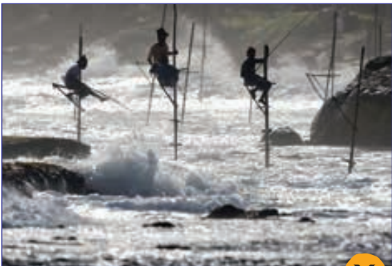
روش جالب ماهی گیران برای صید ماهی در سریلانکا