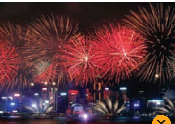
آتش بازی جالب در هنگ کنگ