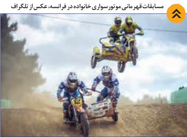
مسابقات قهرمانی موتور سواری خانواده در فرانسه