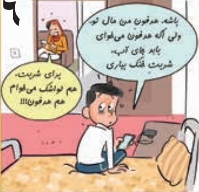
متن: مابری - تصویر ساز: مرادی