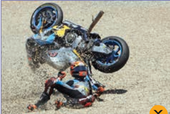
زمین خور دن موتورسوار اسپانیایی در مسابقات جایزه بزرگ اسپانیا

تلاش یک لک لک در حمل مواد لازم برای ساخت لانه