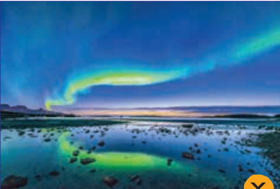
درخشش رنگ ها در زمان غروب آفتاب در یکی از جزایر نروژ