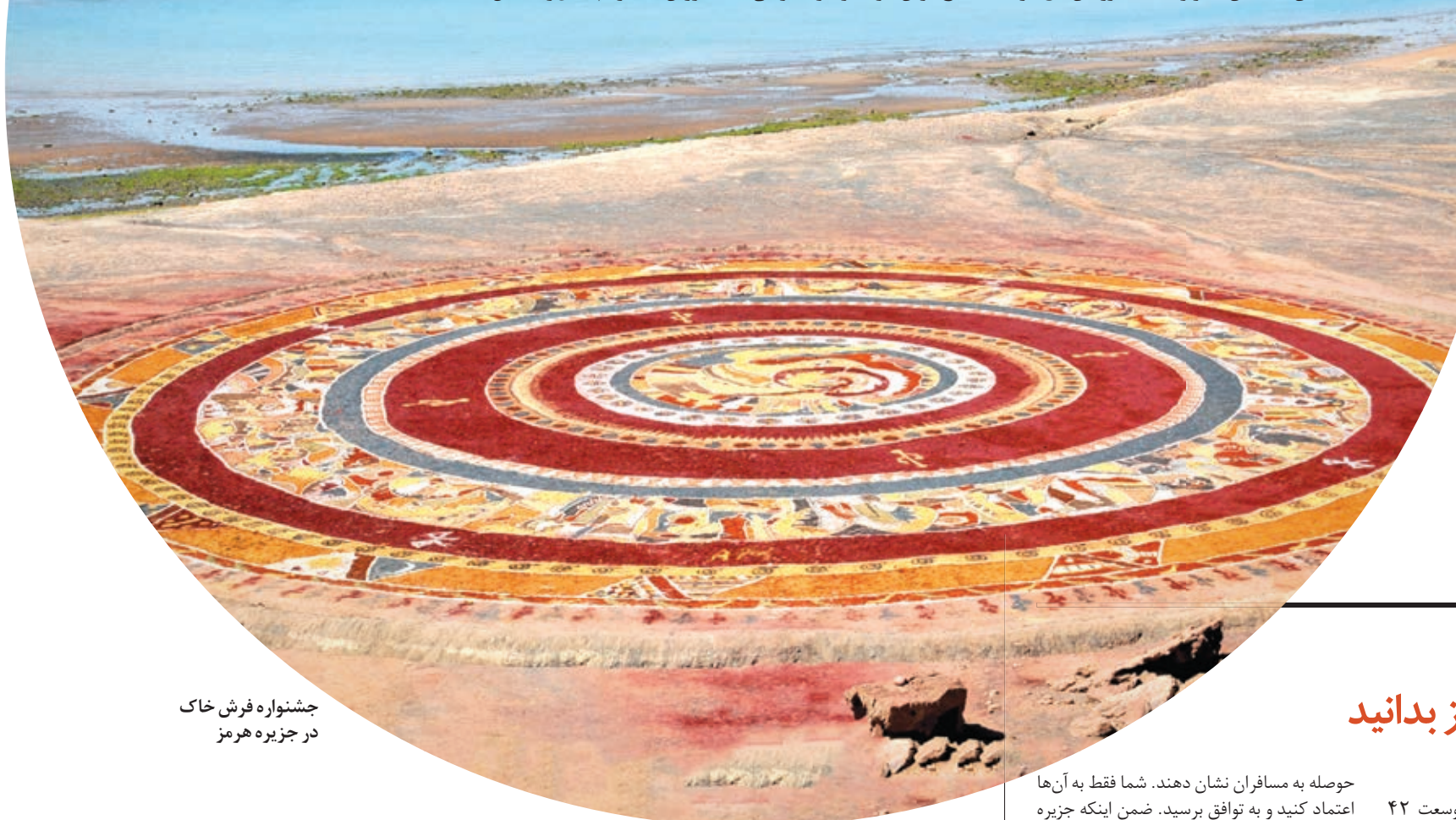
چشمنواره فرش خاک در جزیره هرمز

نشسته و آن قدر که باید، برای مردم کشورمان شناخته شده نیست. شاید از همین روست که در عین ثروت طبیعی و زیبایی منحصر به فردش و در جوار جزایر با شکوه قشم و کیش، در صوری و محرومیتی غیرقابل باور فرو رفته. امروز دهم اردیبهشت، روز ملی خلیج‌فارس است. شاید امروز، روز مناسبی باشد برای شناخت بیشتر از این جزیره رنگین کمانی و مردم اصیل و نجیبش. با ما باشید.