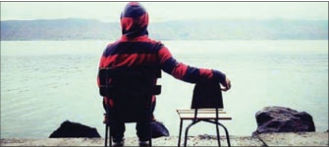
فکر بزرگ دارید، روان پرورنگ

چشم هایتان را ببندید: هیچ وقت ادیت تان نکرده اما حالا فوت کرده و برای همیشه و همیشه، شما را تنها گذاشته و رفته. حالا چشم هایتان را باز کنید: رویه رویتان نشسته، حرف می زند البته گاهی ادیت تان می کند. شما را نمی دانم، من دوست دارم چشم هایم باز باشد. خیلی وقت ها دنیا همین است به همین سادگی.