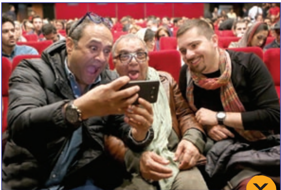
عکسی جالب در حاشیه برگزاری یک نمایش کمدی در تهران