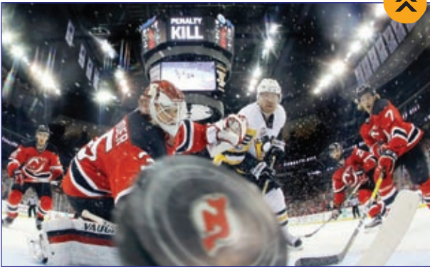
لحظه ورود توپ به دروازه در مسابقات لیگ هاکی آمریکا