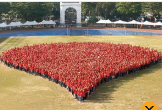
تلاش ۴۸۱۷ نفر برای ساخت نماد یک قطره خون به مناسبت روز جهانی بهداشت در فیلیپین