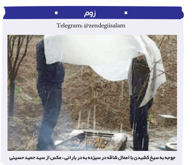
جوجه به سیخ کشیدن با اعمال شاه قه در سبیزده به در بارانی، عکس از سید حمید حسینی

ولی از حق نگذریم این رسم دروغ سبیزده، بعضی جاها هم مفید است. مثلاً وقتی که عکسی خصوصی منتشر می کنیم و بعدش می فهمیم عجب سوتی داده ایم و فوری یک *دروغ_سبیزده می زنیم تنگش و خلاص! کاش یک روزی می مد می شد که اصلا در آن روز دروغ نگوییم، یا دست کم دروغ های کم شاخ تری بگوییم. ولی سخت است، بی خیال!