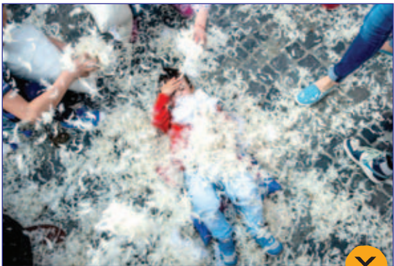
شرکت کنندگان در روز بین المللی جنگ بالش ها در اروپا