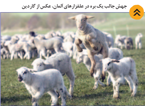
جهش جالب یک بره در علفزارهای آلمان