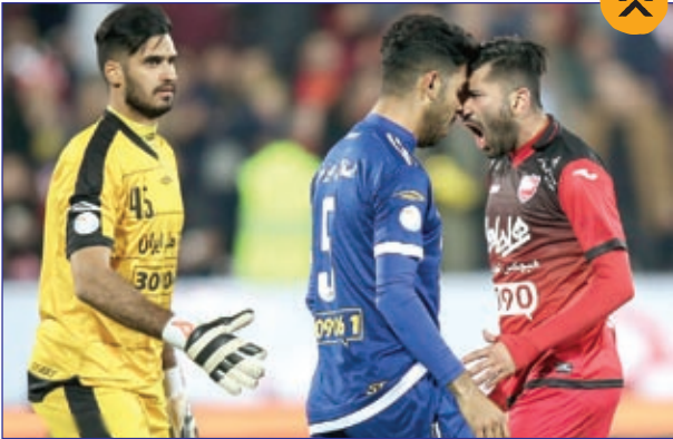
فریاد باز یکن پرسپولیسی پرسر باز یکن استقلال خوزستان