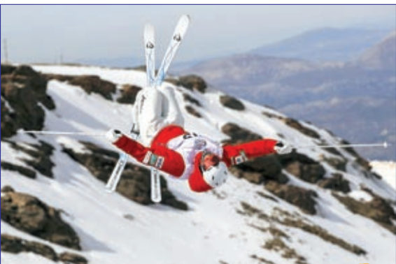
هنر نمایی اسکی باز ژاپنی در مسابقات اسکی قهرمانی جهان در اسپانیا، عکس از یاهو