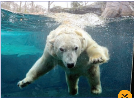
عکسی جالب از شنا کردن یک خرس قطبی