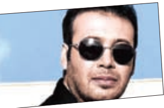
کمال گرایی و سرسختی در او دیده می شود

یکی از رفتار های جنجال آفرین این خواننده، نداشتن اجرای کنسرت با وجود طرفداران میلیونی است؛ تا جایی که مخالفان بر چسب دستگاہی بودن صدا و نداشتن توانایی اجرای زنده را بارها به او زده اند. ادعایی که با صدایش باطل به نظر می رسد؛ اما از دید گاه روانشناسانه تمام این دیده نشدن ها از نوعی ترس اجتماعی نشأت می گیرد. فوبیایی از اینکه نمی داندید بیرون از غار تنهایی چه چیزی انتظار تان را می کشد. نوعی ترس موهوم که فرد خود را بدون هیچ تهدیدی با خطر مواجه می بیند. عکس نگرفتن، مصاحبه نکردن و اجرای زنده نداشتن برای بر هم نخوردن آرامشی است که او در انزوا و تنهایی خود به آن رسیده است. تغییر شرایط و امتحان موقعیت های جدید برای این شخصیت لذت بخش نیست. با وجود اینکه بارها سبک موسیقی خود را تغییر داده اما پای حرف خود در دیده نشدن در جمع ایستاده است. این ترس غالب در بیشتر موارد ریشه در گذشته افراد دارد؛ به گونه ای که آن ها تر جیح می دهند با همان تصویر تکراری از چیزی که هستند زندگی کنند و آرامش داشته باشند.