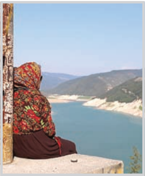
عکس: پرنسی است

اگر شواهد قابل قبولی وجود ندارد، مراقب باشید از روی حدس و گمان و برداشت های خودو دیگران نمی توان به این نتیجه رسید که خیانت رخ داده است. اثبات این ادعا باید بر اساس شواهد درست و غیر قابل انکار باشد، خدای ناکرده اگر به همسر بی گناهتان چنین تهمتیی بزنید جدا از جزای شرعی و حقوقی، آسیب جدی به رابطه چندین و چند ساله خود وارد کرده اید. به تجرب به اثبات شده است وقتی زوجین سال ها در یک رابطه تخریب شده و منفی با هم سر می کنند، یکی از دفاع های بسیار