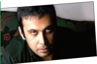
از آرامش خودش مراقبت می کند

مطرح شدن همیشه سر و صدا و جنجال به پا کردن نمی خواهد؛ گاهی شما در عین سکوت و دیده نشدن هم حاشیه ساز می شوید. سکوت او یعنی تعداد گفت و گوی هایش کمتر از انگشتان دست است و عکس و فیلم های فراوان با یز های مختلف در روزمرگی های او دیده نمی شود. چاووشی دقیقا از زمانی سر زبان ها افتاد که غیر از یک صدای خش دار و سوزناک، منبع دیگری برای معرفی خود به مخاطب ارائه نداد. این روند همچنان ادامه داشت تا جایی که بعد از تبدیل شدن به خواننده ای پر طرفدار هیچ فردی مصاحبه و عکسی از این خواننده نامرئی پیدا نکرد تا به تمام سوالات در ذهنش پاسخ دهد. این کنجکاری گوشه ذهن همه مخاطبان ماند تا هر فردی با تصویری در ذهنش برای خود یک چاووشی بسازد. او به نقل از اطرافیان نزدیکش اصلا منزوی و افسرده نیست و برعکس در خوش مشربی زبانز دست. بچه جنوب است و این ویژگی او هم ارتباط مستقیمی با این قضیه دارد. با اینکه این دیده نشدن تا امروز حاشیه های زیادی برایش ساخته اما او نشان داده است که در تصمیماتش جدیت و وسواس خاصی دارد.