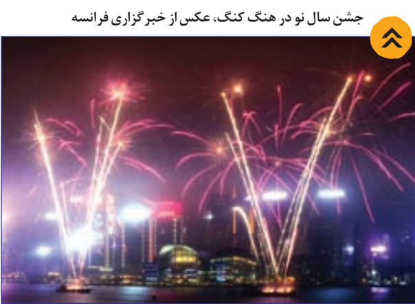
جشن سال نو در هنگ کنگ