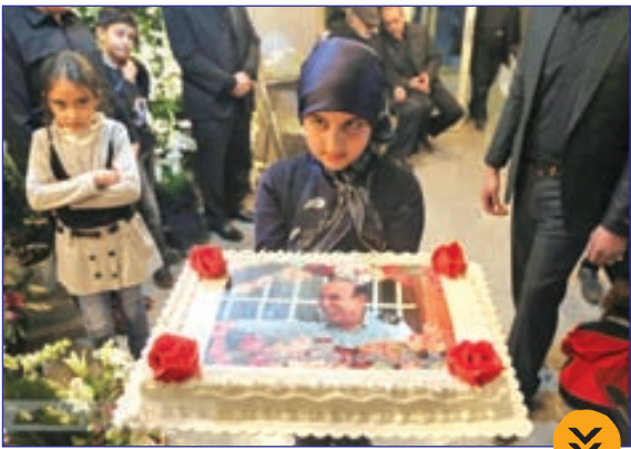
مراسم تولد آتش نشان شهید علی امینی