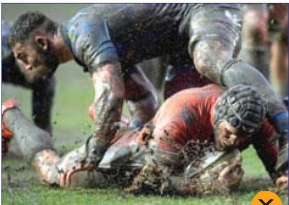
مسابقه راگبی در شرایط بد آب و هوایی ولز