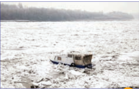
این قایق کوچک، در رودخانه یخ‌زده «دانوب» گیر کرده است!