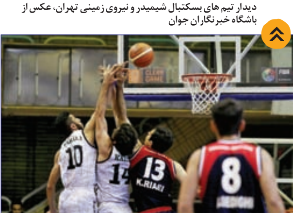
دیدار تیم های بسکتبال شیمیدر و نیروی زمینی تهران، عکس از باشگاه خبرنگاران جوان