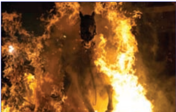
آیین عبور اسب‌ها از درون آتش موسوم به «لومیناریاس» در مادرید اسپانیا