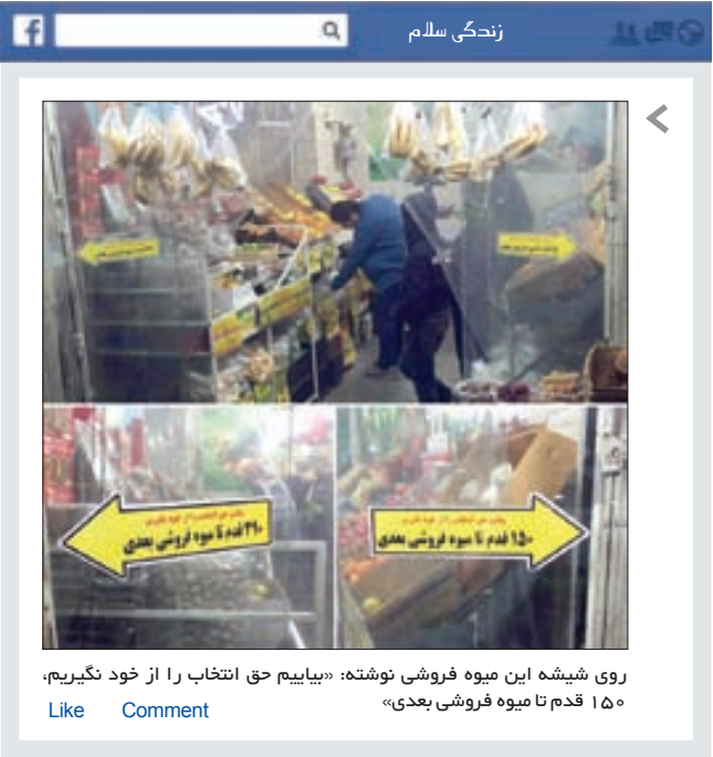
روی شیشه این میوه فروشی نوشته: «بیاییم حق انتخاب را از خود بگیریم، ۱۵۰ قدم تا میوه فروشی بعدی»

* پرورنده «زندگی سلام» روز یکشنبه که درباره فرشته‌های در راه‌مانده بود، بسیار عالی و تأمل برانگیز بود. ولی من با این نظر مخالفم چرا که هیچ مادری از فرزندش نمی‌گذرد حتی مادر معता. هستند مادران متعددی که بعد از تولد به بهای جان خودشان از فرزندشان به نحو احسن و سالم نگه‌داری می‌کنند. لطفا همه را به یک چشم نبینید. * چه‌طوری می‌تونم براتون مطلب ارسال کنم؟ ماوشما: از طریق تلگرام @zendegiisalam یا ایمیل photo@khorasannews.com