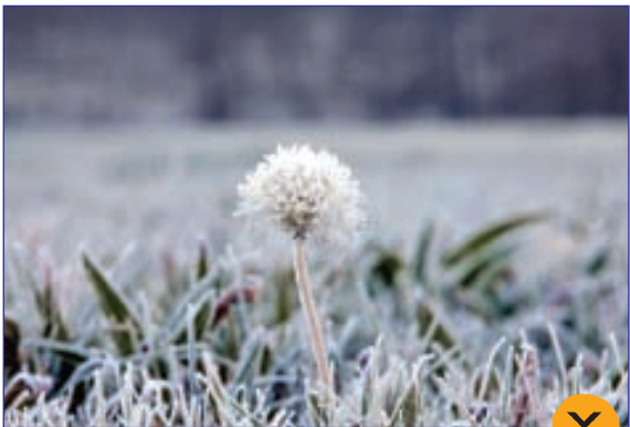
یخ زدن قاصدک در سرمای شدید «گالیسیا»ی اسپانیا