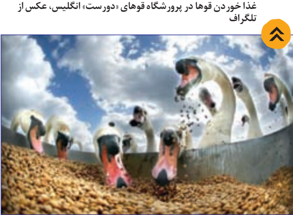
غذا خوردن قوها در پرورشگاه قوهای «دورست» انگلیس