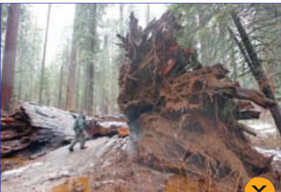
سقوط درخت سکویای بزرگ و ۱۰۰۰ ساله در جنگلی در کالیفرنیا بر اثر توفان