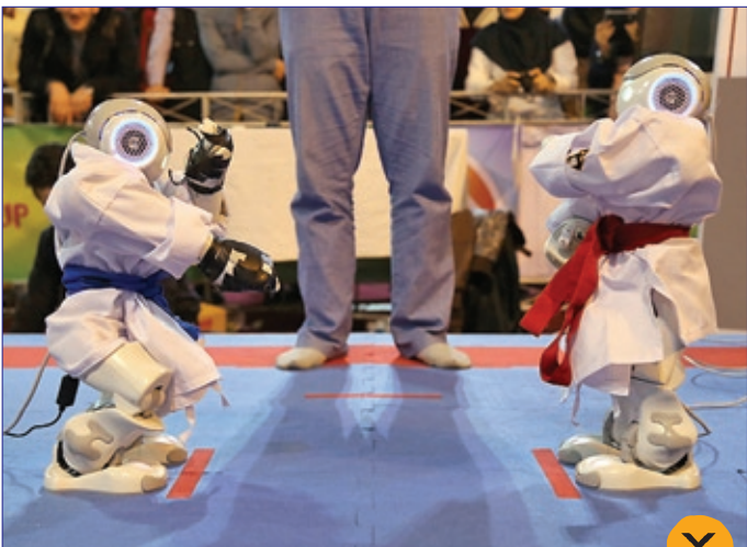
ششمین جشنواره روباتیک و هوش مصنوعی دانشگاه امیرکبیر، عکس از خبرگزاری دانشجو