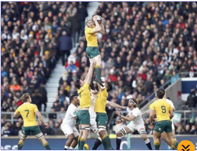
دیدار تیم‌های راگبی انگلیس و استرالیا!