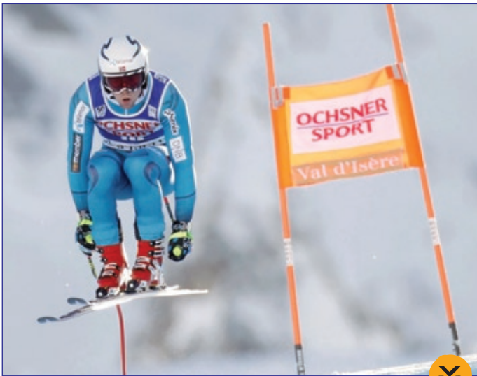
جام جهانی اسکی الپاین در اترفاعات فرانسه

تصویری زیبا از کیهکشان راه شیری و نوع خاصی از درخت کاج در جنگل ملی «اینیو» در غرب آمریکا