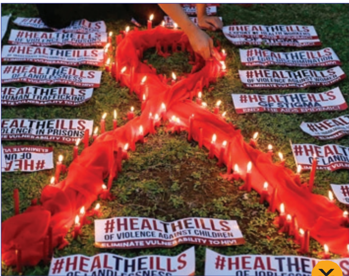
اجرای نمادین لغاتن سلامت برای آگاهی دادن به مردم جهان در روز جهانی ایذ