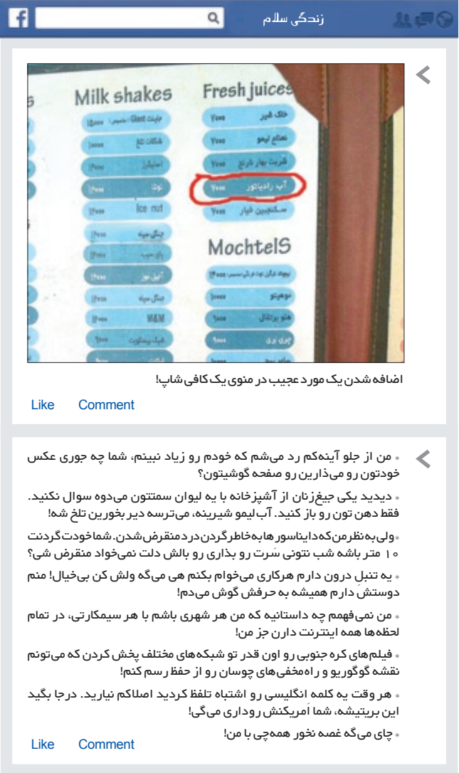
افزافه شدن یک مورد عجیب در منوی یک کافی‌شاپ!

من دریافته‌ام که دوست داشته شدن هیچ و اما دوست داشتن همه چیز است و بیش از آن براین باورم که آن‌چه هستی ما را بر معنی و شادمانه می‌سازد، چیزی جز احساسات و عاطفه ما نیست... پس آن‌کس نیک بخت است که بتواند عشق بورزد...! برگرفته از کتاب «شادمانی‌های کوچک»، مرمان هسه