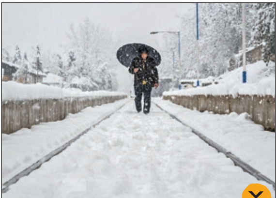
برف سنگین پاییزی در مازندران، عکس از خبرگزاری میزان

«الان رابرت» مشهور به اسپایدر من فرانسوی، بدون طناب و تجهیزات، از برج ۱۴۵ متری در مرکز بندر «بارسلون» اسپانیا بالا می‌رود! عکس از آسوشیتد پرس