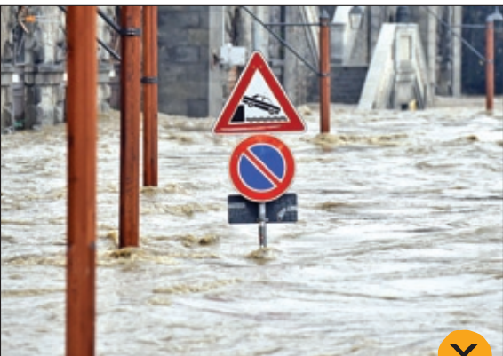
سیل شدید در شهر «تورین» ایتالیا