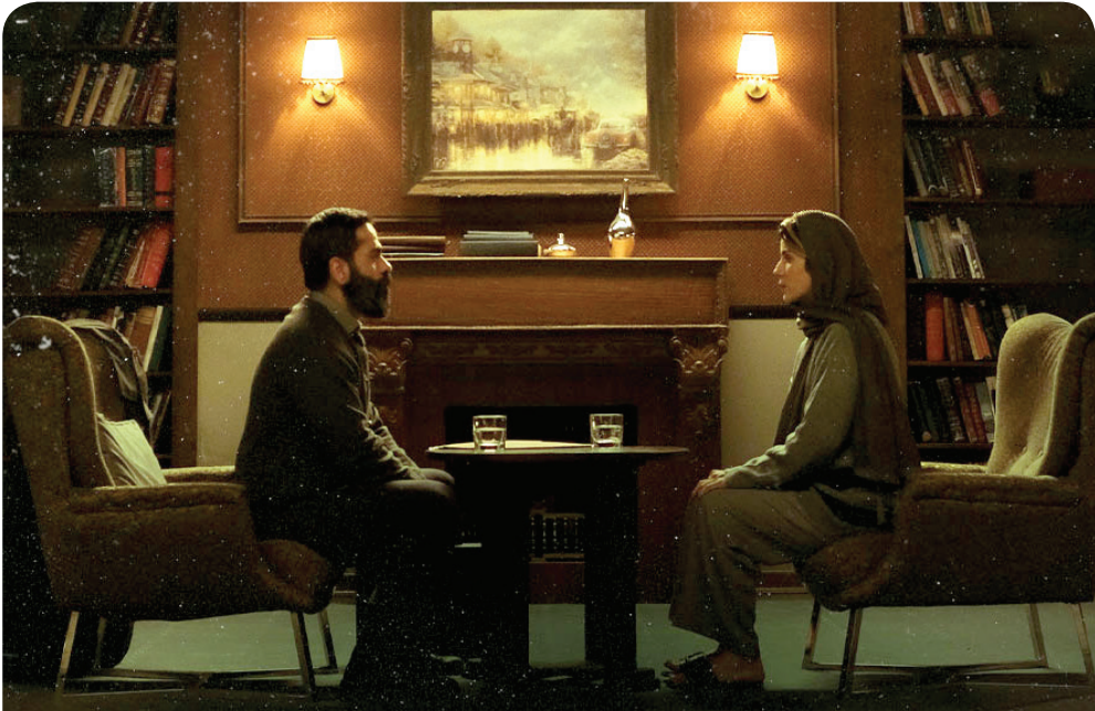
نمایی از سریال در مانگر