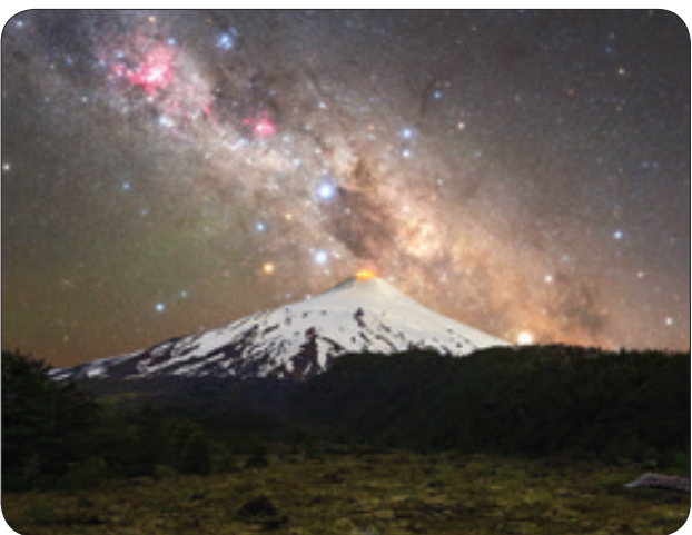
آتشفشان و کهکشان، شیلی

ترجمه: شرایط زندگی پس از توفان غیر قابل تحمل بود.