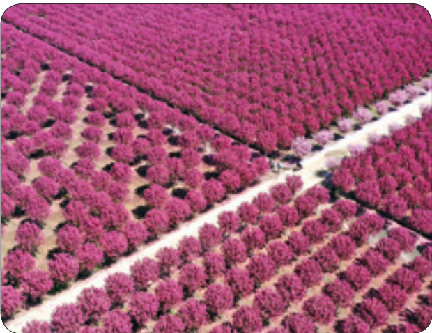
باغ یگونیادر چین