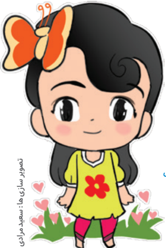
تصویر سازی ها: سعید مرادی