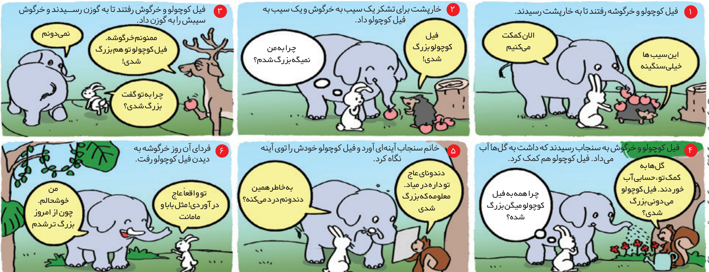
نویسنده: نیلا هنرکار تصویرگر: سعید مرادی