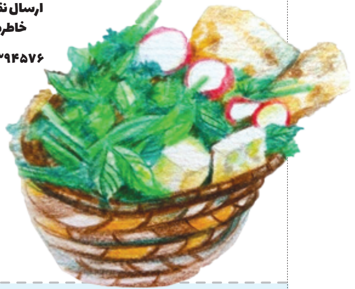
نمونه‌سازی ها: الهام کرمانی