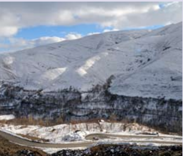
طبیعت کوهستانی طرفیه

تصاویر خود را به آدرس زیر ارسال فرمایید photo@khorasannews.com