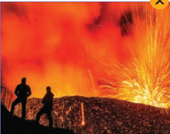
تماشای خطرناک یک آتش‌فشان در جزیره فرانسوی «رونین» در اقیانوس هند