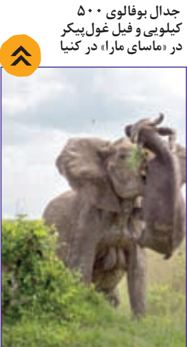
جدال بوفالوی ۵۰۰ کیلویی و فیل غول‌پیکر در «ماسای مارا» در کنیا