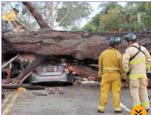
افتادن یک درخت در جاده‌ای در «کالیفرنیا»ی آمریکا و جان سپردن راننده، عکس از آسوشیتد پرس