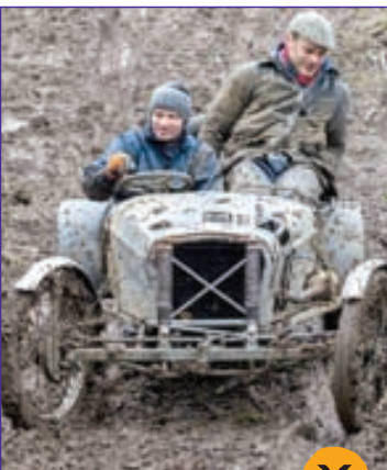
مسابقه رانندگی در گل با خودروهای ساخت ۵۰ سال پیش در انگلیس!