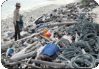
سی ان ان - طبق آمار جهانی ۴۱۴ میلیون قطعه پلاستیکی در جزایر دور افتاده استرالیا به چشم می خورد. بر اساس بررسی های انجام شده تقریبا یک میلیون کفش و بیش از ۳۷۰ هزار مسواک در بین زباله های یافت شده در ساحل جزایر دور افتاده «کوکوس» در اقیانوس هند دیده شده است. این جزایر دور افتاده بهترین مدرک و محل برای فهمیدن چرخش زباله های پلاستیکی در سراسر جهان است. به گفته حامیان محیط زیست اولین تنه اهر اهل قابل قبول، کاهش تولید و مصرف پلاستیک و بهبود مدیریت زباله ها برای جلوگیری از ورود این مواد به اقیانوس هاست.