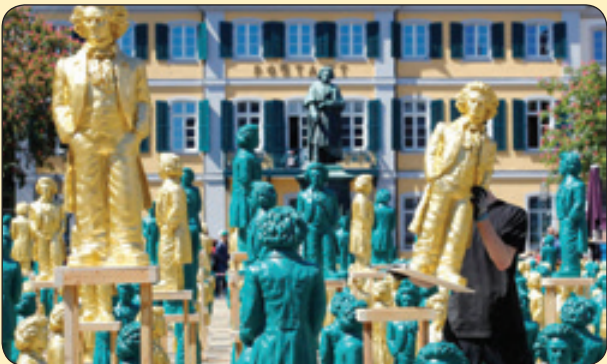
آماده سازی مجسمه های پلاستیکی بهوون برای جشن تولد ۲۵ سالگی این آهنگ ساز در زادگاهش، آلمان

با من بیا به رویاهام برایت رویایی کشیدم از جنس دریا چشمانت خود دریاست همان قدر بی پایان بنشین بر ساحل این دل