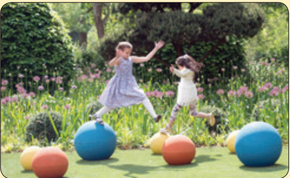
تلگراف | باغ کودک کان، انگلستان