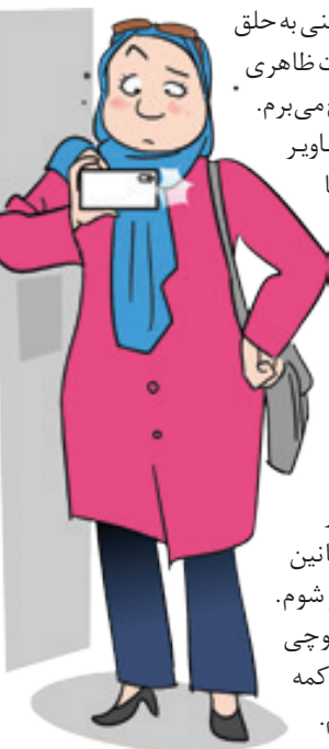
تصویر سازی ها: سعید مرادی

من همانی هستم که از عکس گرفتن متنفر بود؛ یعنی درست نقطه مقابل عباس جدیدی. آرزو به دلم ماند که کسی پیدا شود که افق زاویه بدمن را بداند، برای همین در ۹۰ درصد عکس هایی که دیگران از من می گرفتند فقط با تست دی ان ای قابل شناسایی بودم. البته الان اوضاع بدتر هم شده، رویارویی با دوربین جلویی از معضلات اساسی زندگی من بود. بزرگترین فوبیای زندگی ام دیدن خودم در دوربین مدار بسته مغازه ها بود. همه این چند سالی که شما سلفی در آسانسور می گیرید، من از روی خودم در آسانسور شرمند بودم و پشت به آینه در آسانسور می ایستادم. یک بار که می خواستم سوار آسانسور شوم، وقتی روبه روی ایستادم و در باز شد، چشمم به تصویر دختری افتاد که ظرف سه ثانیه قضاوتش کردم، چقدر زشت و بد لباس است و چه اعتماد به نفسی دارد که با این قیافه از خانه بیرون آمده است. دو ثانیه بعد فهمیدم که آن تصویر خودم در آینه بود. برای این که خودم را ببخشم در همه کارزارهای مجازی «دوست داشتن خود» عضو شدم. دو میلیون تومان به حساب یکی از همین استاد بزرگ های ورکشاپ اعتماد به نفس ریختم و در نهایت دایورت شدم به یک کلینیک زیبایی در فرانیه تهران. قاعدتا باید این داستان پایان خوبی می داشت اما خب حالا از عدم تقارن در گونه چپ و راست،