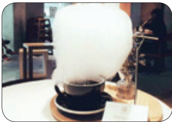
دبلی میل - یک کافی شاپ در چین با ابتکار جالبی که به خرج داده، حسایی معروف شده است. این رستوران نوعی قهوه آمریکانو با باران شیرینی ارائه می دهد به این شکل که بالای قهوه داغ پشمت قرار می گیرد و با گرم شدن، باران شکروری قهوه می بارد. این قهوه به قیمت ۹ دلار فروخته می شود.