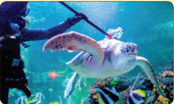
پاک سازی آکواریوم و موجودات داخلش توسط غواصان، آلمان