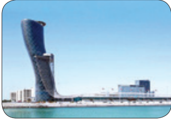
گینس - برج «دراو» پایتخت «ADNEC» در ابوظبی کج ترین برج در دنیاست که در کتاب رکوردهای گینس هم ثبت شده است. این برج ۳۵ طبقه با ارتفاع ۱۶۰ متر در امارات متحده عربی ۱۸ درجه به سمت غرب انحراف دارد. برج معروف پیزا در ایتالیا که به کج بودن معروف است فقط ۴ درجه انحراف دارد. «ماترین دوفرین» طراح این برج توضیح می دهد که برای مقاومت در برابر زلزله، هسته مرکزی ساختمان دقیقاً در جهت مخالف خمیدگی آن و مستقیم به سمت بالا طراحی شده است.