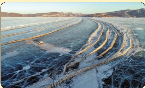
ماشین سواری روی رودخانه یخ زده، روسیه