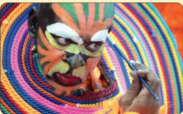
مردی از اهالی هائیتی خود را برای شرکت در جشنواره گردشگری گریم می کند، آلمان