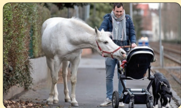
گتی |میچ | محبت حیوانی

● داشتم فکر می کردم برای عید کجا برم؟ به این نتیجه رسیدم از این ور خونه برم اون ور خونه. خیلی جاها هست هنوز نرفتم، پشت یخچال، تو کمدهای ری، بالای لوسترو... ایشالا سفر باشه برای سال های دیگه! ● خیال ما کچل ها از عیدی دادن به آرایشگر ها راحت، در عوض با پولش می ریم یه کلاه نو می خریم! ● مادر س نمی خونیم، فقط یه تایمی با عذاب وجدان گوشی دست مونه! ● کم کم به دوران «همین چهار تا پلاستیک خرت و پرت شد یک میلیون تومن» وارد شدیم! ● کسی رو که خوابیده میشه بیدار کرد، اما کسی رو که تو متری خودش رو به خواب زده تا جاش رو به کسی نده، نمیشه بیدار کرد! ● اون لحظه که داری فیلم می بینی ماوس رو تکون میدی تا ببینی چقدر ش موئده... این آپشن رو برای بعضی آدم ها که دارن باهام حرف می زنن لازم دارم! ● خونه تکونی تو خونه ما این جوریه که از نظر مامان خانم تمام لوازم من و پدر اضافیه، حتی من خودم شدیداً اضافی ام... ولی ظرف های خودش که از دوران ژوراسیک و عصر دایناسور ها موئده اضافی نیست و ممکنه یه روز به درد بخوره!