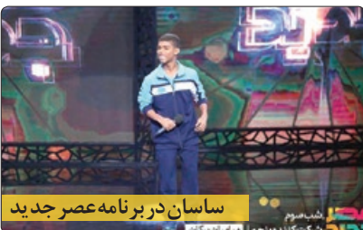
ساسان در برنامه عصر جدید