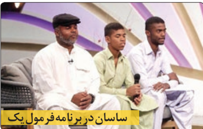
ساسان در برنامه فرمول یک