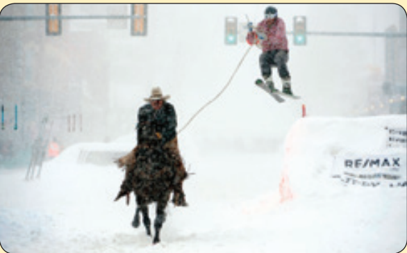
فرانس پرس | تفریق مسابقات اسکی واسب دوانی، کلرادو

دیلی میل - زمین های خشکاش در هند هدف حمله طوطی های معتاد به مواد مخدر قرار گرفته است! به گفته کشاورزان، دسته بزرگی از طوطی ها حدود ۳۰ تا ۴۰ بار در روز از این گیاهان تغذیه می کنند. کشاورزان مجبورند شب و روز نگهبانی دهند و با صدای بلند و عجیب آن ها را بترسانند، اما هیچ فایده ای ندارد. عجیب این جاست که پرندگان در دسته های زیاد معمولا پر سر و صدا هستند اما این طوطی ها خیلی هوشمندانه در سکوت مطلق به محصولات آسیب می زنند.