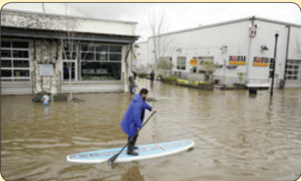
گتی ایمیج | قایق رانی در خیابان های سیل زده، ایالات متحده