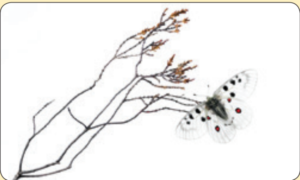
گاردین | زیبایی های طبیعت