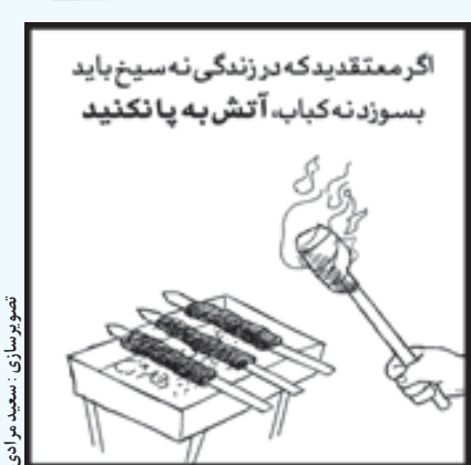
تصویرسازی: سعید مرادی

...مرد رو به عبدا... گفت: «و اما من! هرگز برای امام خویش تکلیف معین نمی‌کنم، که تکلیف خود را از حسین(ع) می‌پرسم. و من حسین(ع) را نه فقط برای خلافت، که برای هدایت می‌خواهم. و من... حسین(ع) را برای دنیای خویش نمی‌خواهم، که دنیای خویش را برای حسین(ع) می‌خواهم. آیا بعد از حسین(ع) کسی را می‌شناسی که من جانم را فدایش کنم؟ و رفت. عبدا... مات ماند. وقتی مرد دور شد، عبدا... لحظه‌ای به خود آمد. برگشت و اسب خویش را آورد و مرد را صدا زد: «صبر کن، تنها و بی مرکب هرگز به کوفه نمی‌رسی!»