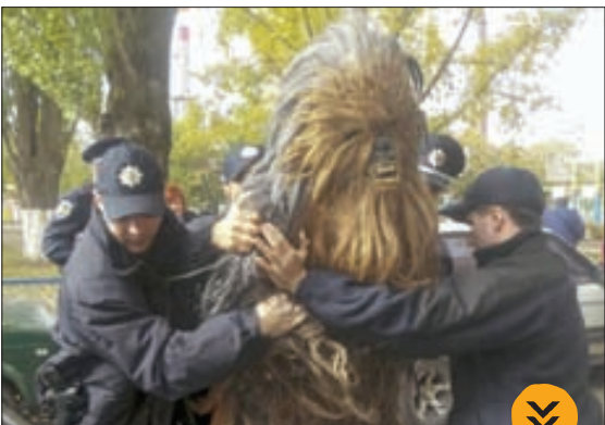
پلیس اوکراین، مردی را که شبیه شخصیت‌های فیلم «جنگ‌های ستاره‌ای» لباس پوشیده، دستگیر کرده است.