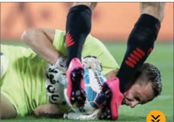
برخورد مهاجم پرسپولیس و دروازه بان ملوان در دیدار این دو تیم