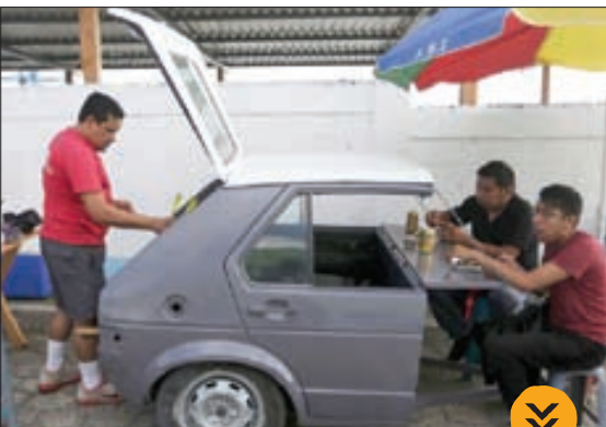
فست فودی خیابانی در شهر «میکسکو» که گواتمالا از پدنه یک خودرو ساخته شده است!