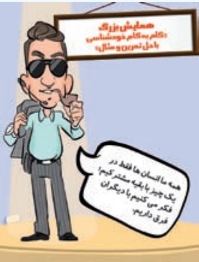
ایده و اجرا: صابری و مرادی