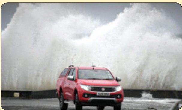
توفان با سرعت ۱۱۲ کیلومتر بر ساعت در انگلستان

پاهای تاول زده ام واژه های عبور را از یاد برده اند!