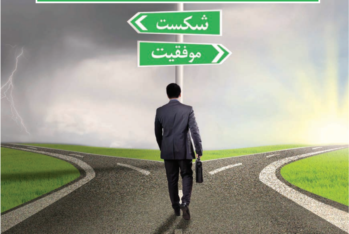
گروه خانواده و مشاوره