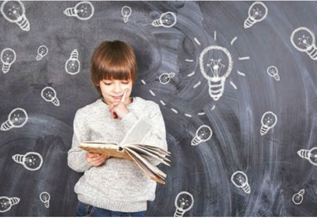
منابع: دانشنامه رشد، پورتال جامع علوم انسانی، تیتیان