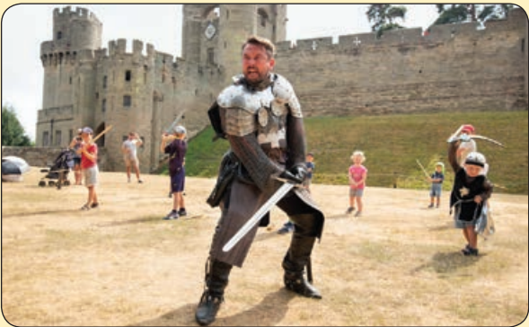
هنرمندی در محوطه یک قلعه تاریخی به کودکان رزم شوالیه‌ای آموزش می‌دهد، انگلستان

من که از آتش دل چوَن خم می‌در جوشم مهر بر لب زده خون می‌خورم و خاموشم قصد جان است طمع در لب جانان کردن تو مرا بین که در این کار به جان می‌کوشم