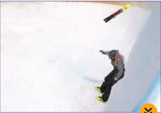
سقوط ورزشکار در المپیک زمستانی کره جنوبی