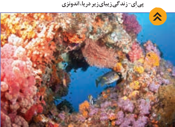
پی‌ای- زندگی زیبایی زیر دریا، اندونزی