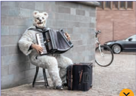
نوازنده دوره گرد با لباس مبدل، آلمان