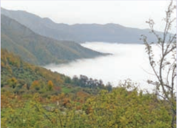
روستای فیل بند

تصاویر خود را به آدرس زیر ارسال فرمایید photo@khorasannews.com