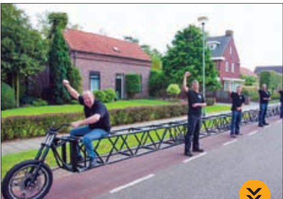
* دراز ترین دوچرخه جهان با ۳۵ متر طول