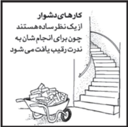
تصویر سازی: سعید مرادی