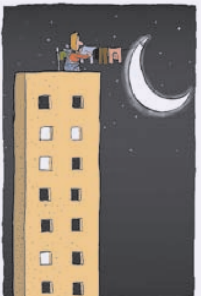
در حاشیه مرتفع شدن ساختمان ها