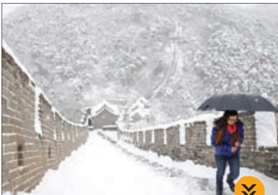
* نمایی زمستانی از دیوار چین