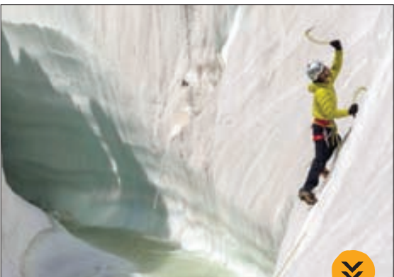
* یخ نوردی در کوه های یخی کاراکورام پاکستان