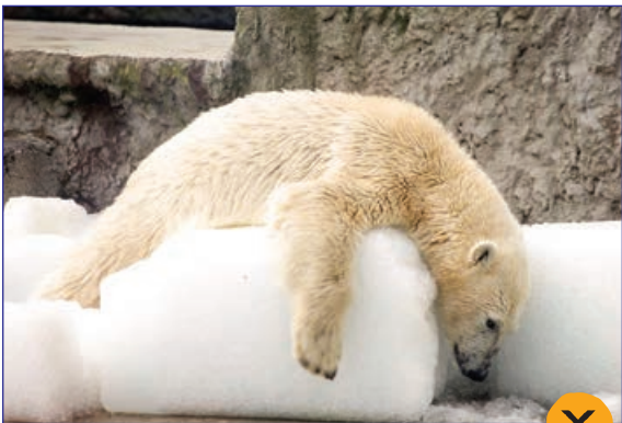
دراز کشیدن خرس قطبی روی یخ برای خنک شدن در گرمای ۳۰ درجه ای مجارستان، عکس از خبرگزاری فرانسه

مسابقات بین المللی سواری گرفتن از اسب های وحشی در کانادا، عکس از گتی ایمچ