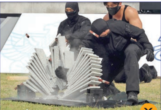
یکی از نمایش های رزمی واحدهای ویژه پلیس در کره جنوبی