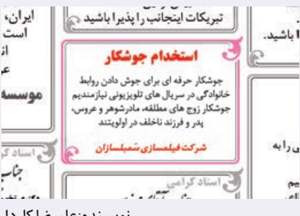
نویسنده: علیرضا کاردار