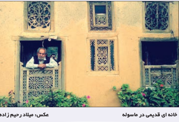
خانه ای قدیمی در ماسوله

مخاطبان گرامی، شما می توانید عکس های جالب تان را به ایمیل photo@khorasannews.com یا در تلگرام به شماره ۹۲۱۵۰۳۹۱۵، بفرستید تا با نام خودتان چاپ کنیم.