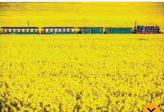
یک لکوموتیو از کار افتاده از سال ۱۹۵۳ در میان گل ها در آلمان