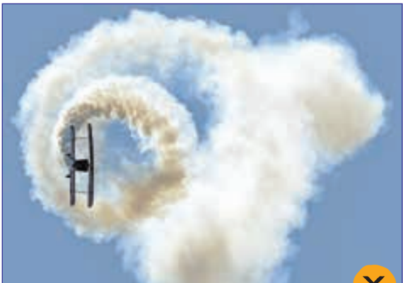
هنر نمایشی در یک نمایش هوایی، عکس از گاردین

متقاضیان سقوط تفریحی با طناب و لباس های رنگی از بزرگ ترین پل سیدنی، عکس از گاردین