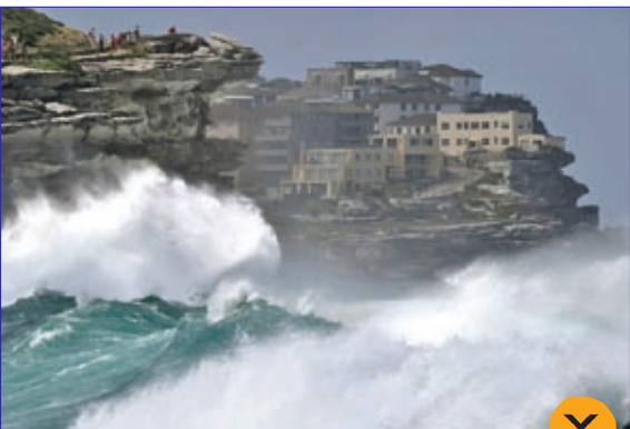
لحظه برخورد امواج بزرگ و شگفت انگیز دریا با ساحل در سیدنی استرالیا