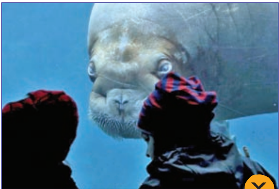
نگاه جالب یک شیر ماهی به باز دید کنندگان در پارک حیوانات آلمان

تصویر لحظه افتادن بازیکن بسکتبال در مسابقه تیم های شیمیدر و پتروشیمی