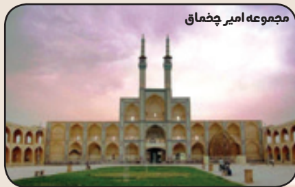
مجموعه امیر چشماق