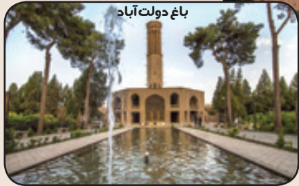
باغ دولت آباد

من اولین شهر خشتی دنیا و دومین شهر تاریخی دنیا بعد از ونیز ایتالیا هستم. من آب و هوای متنوعی دارم. از یک طرف بیابان و تپه‌های ریگ و از یک طرف ارتفاعات زیبای شیرکوه و دره‌های سرسبز و دامنه‌های اون باعث شده جذاب و دیدنی باشم. به من شهر بادگیرها می‌گن چون بیشترین تعداد بادگیرهای ایران رو دارم.