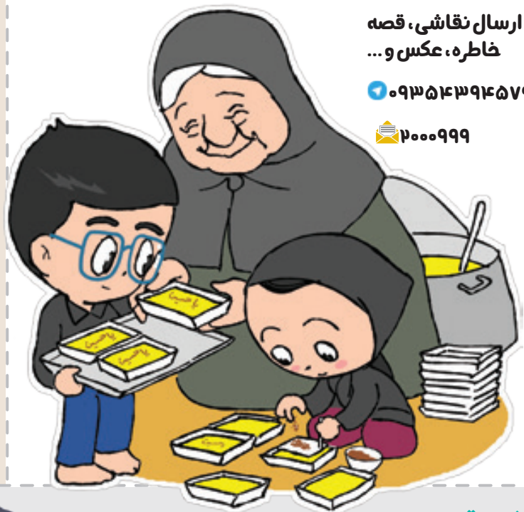
تصویرسازی ها: سعید مرادی